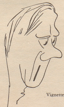
Vignetten: R. Doetzkies