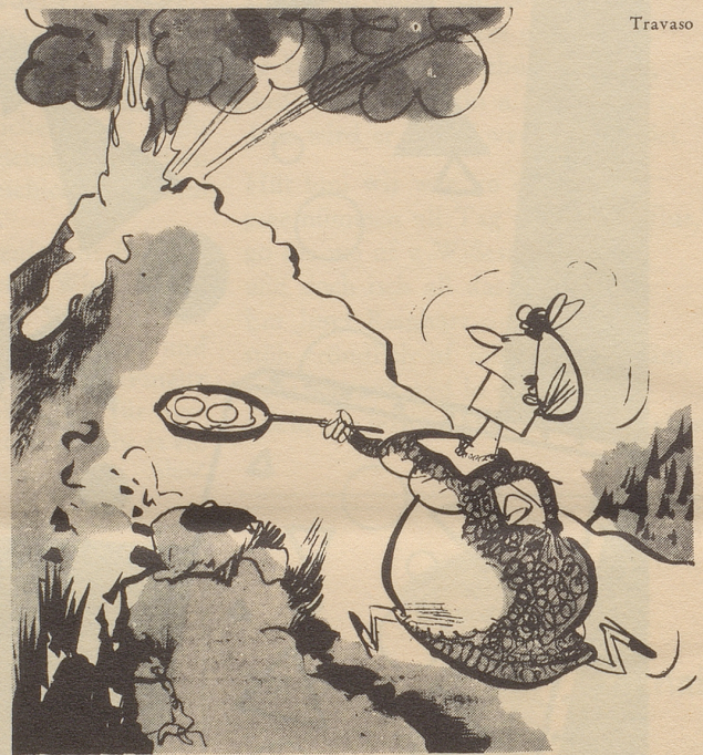
Atna in Tätigkeit

Neulich besuchte ich die Industriestadt Essen im Ruhrgebiet. Beim Gang durch die rußgeschwärzten Straßen kam ich in den Stadtteil Rüttenscheid und stieß dort unvermutet an einem Abend auf das traute Wort «Rütli», das in der Zusammensetzung «Rütli-Kino» in riesigen Leuchtbuchstaben an der Außenwand eines Hauses prangte. Ich vermutete, daß der Kinobesitzer ein Schweizer sei, der hier in der Ferne seinem Heimatlande habe ein Denkmal setzen wollen. Ich begab mich in das Innere, um dem Rütli-Besitzer landsmannschaftlich die Hand zu drücken. Vorsichtigerweise fragte ich aber die Dame an der Kasse zuerst, was der Name «Rütli» hier zu bedeuten habe. «Na», lautete die Antwort, «das weiß doch hier jedes Kind! Rütli, das ist die Abkürzung für Rüttenscheider Lichtspiele!» FB