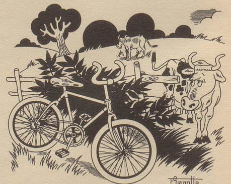
Die illegale Konkurrenz