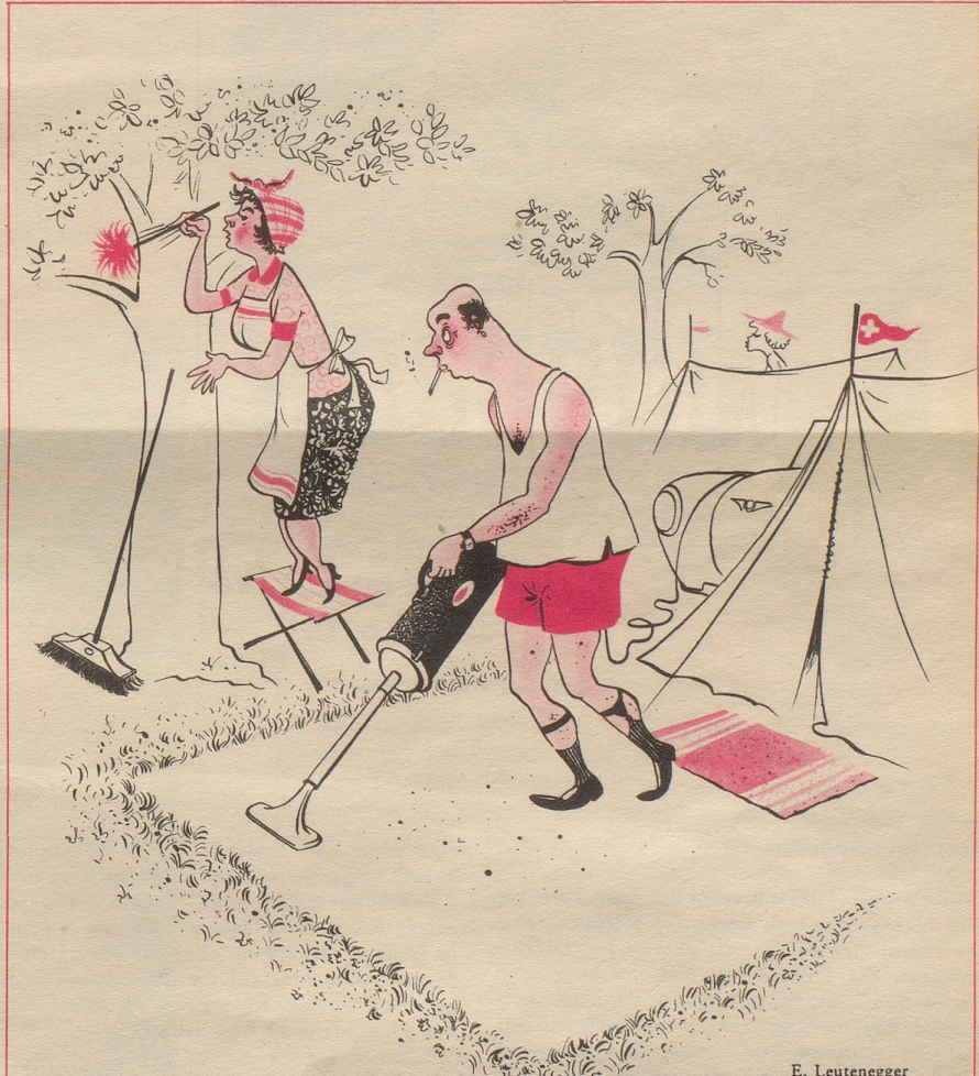
«Wenn i scho dä Kämpingrummel mitmache, so söll doch alls so ordelig gaa wie deheim!»

aufgefischt und aufgetischt Wie United Press meldet, die es ihrerseits aus dem Ostdeutschen Rundfunk aufgeschnappt zu haben erklärt, haben die Organisatoren des diesjährigen «Jugendtreffens» in Warschau Königin Elisabeth, Präsident Eisenhower, Präsident Coty und Präsident Woroschilow nach Warschau eingeladen. Queen Elizabeth, das wäre noch zu begreifen, obschon Prinz Charles sicher noch jugendlicher wäre –, aber die bejahrten Herren Präsidenten sind doch sicher über das Alter der naiven Freude an Marionettentheater hinaus. Mit Ausnahme des Herrn Präsidenten Woroschilow, der daran von Haus aus gewöhnt ist und, wie man aus sonst zuverlässiger Quelle vernimmt, selbst an Drähten zappelt. Jedenfalls wollen wir in Zukunft nicht mehr von Unbescheidenheit reden, wenn der Kanarienvogelzüchterverein Hinter-Krachlingen zur Feier seines fünfjährigen Bestehens glaubt eine Delegation des Bundesrates erwarten zu dürfen. AbisZ