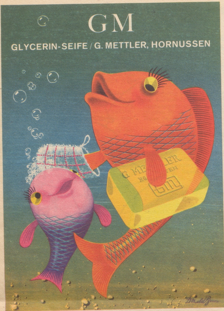
Jää, das isch si dänn!

Mark Twain, der berühmte Humorist, besuchte in Begleitung einiger Landsleute Italiens.