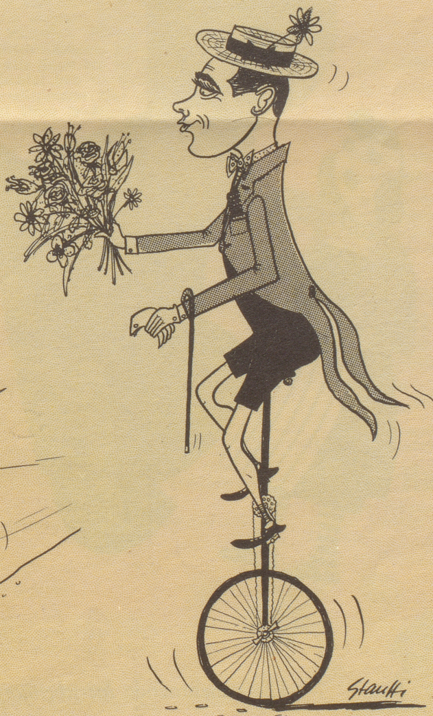
Pedaleur de Charme Kobler