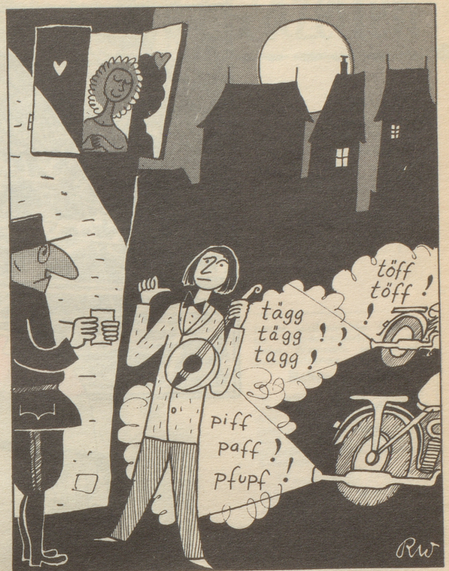
Es schinkt und chnallt und chlopft und schüßt Der Ständchenbringer wird gebüßt.