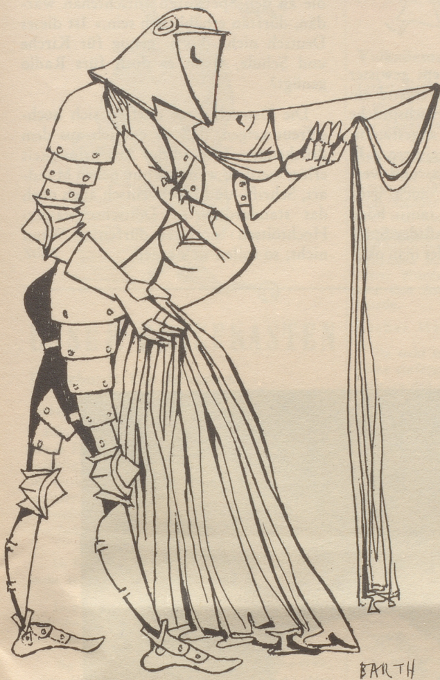
Kein Ritter ohne Dornen