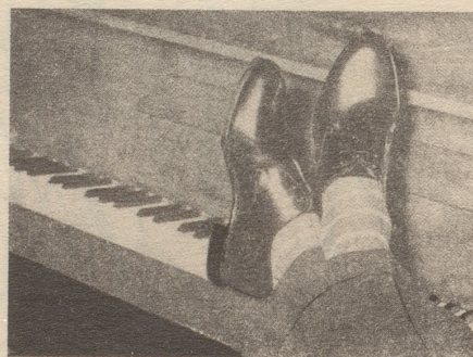
Schwarze zweifärbige Halbschuhe in der südlichen spitzen Machart werden immer populärer und sind, weil sie jugendlich wirken, auch bei älteren Semestern recht beliebt.

Beiliegend ein Ausschnitt aus einer Modebeilage: