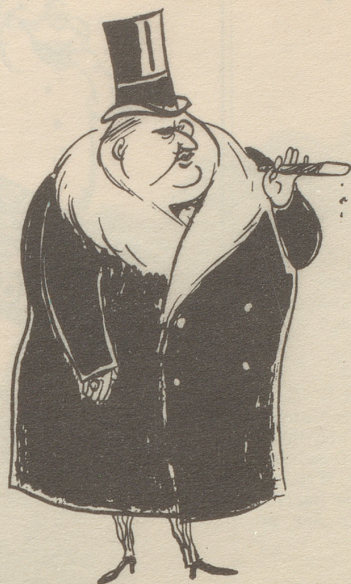
Früher sah man so die Vertreter der «Bourgeoisie»