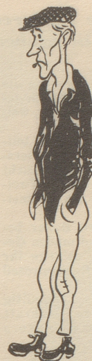
... und so die Repräsentanten des revolutionären Proletariats