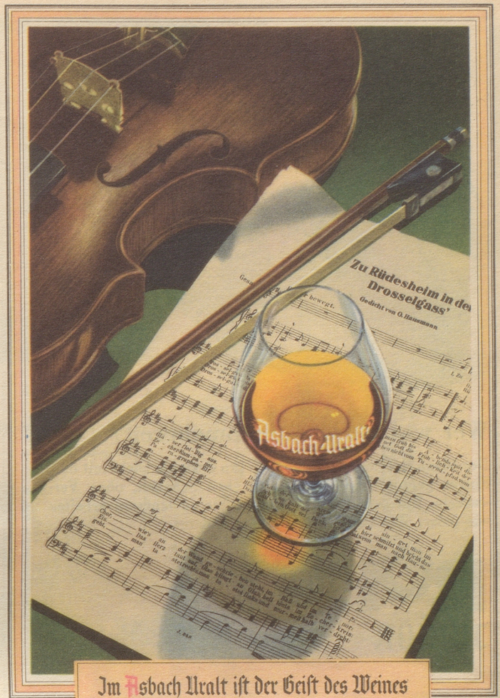
Im Asbach Uralt ist der Geist des Weines