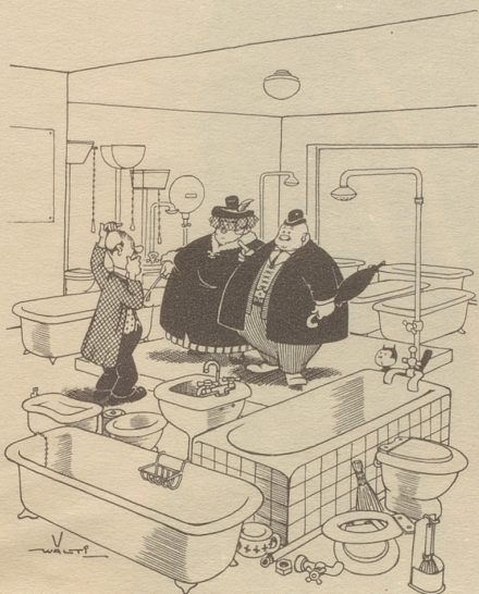
«Wir hätten gern eine runde Badewanne...» Illustrationsprobe aus dem Wälti-Buch