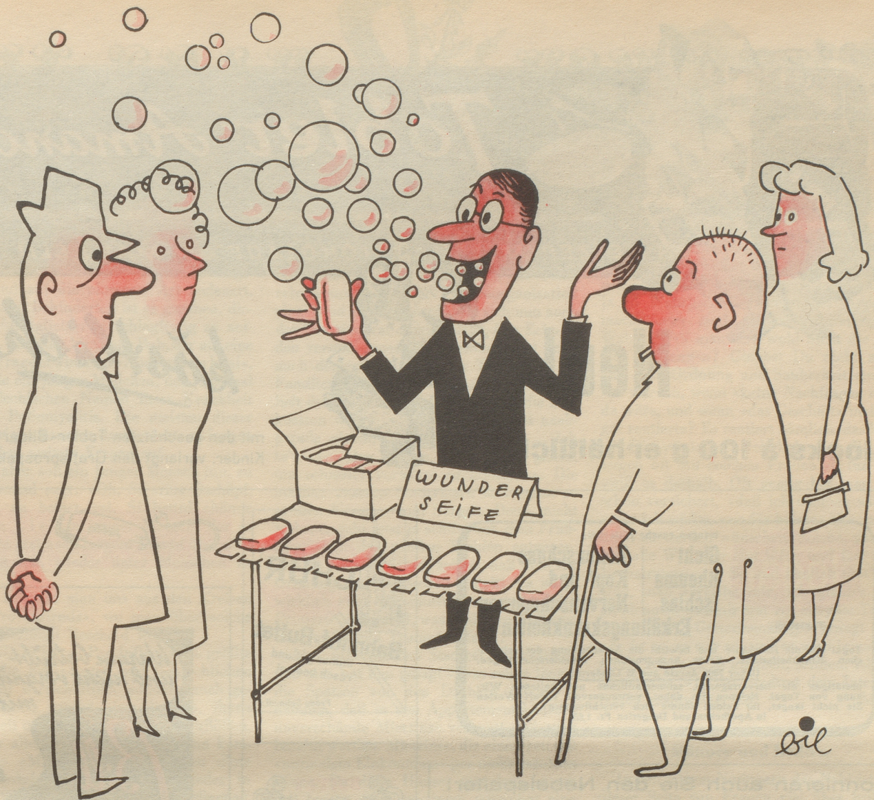
Sie spricht für sich selbst!