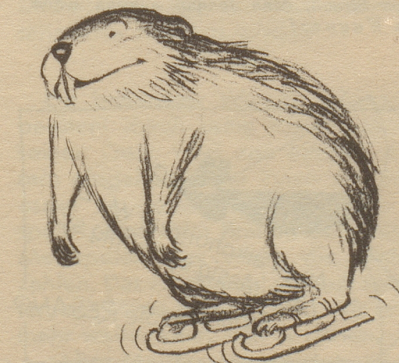
Illustrationsprobe aus «Aus meiner Menagerie»

«Jeder kennt Giovannettis fröhliche Tierzeichnungen aus dem Nebelspalter. Es bietet aber die Sammlung seiner poesievollen Einfälle in einem eigenen Bilderbuch «Aus meiner Menagerie», das im Nebelspalter-Verlag Rorschach in sorgfältigster Ausführung herausgegeben wurde, eine freudige Ueberraschung. Man blättert vergnügt und verweilt sich versonnen bei seinen Murmeltieren, Igeln und Vögeln, die so viel Menschliches haben, daß wir uns in ihnen wiedererkennen.» Neues Winterthurer Tagblatt