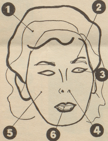
Gesichtsschema als Beispiel