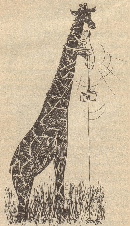
Der Zahnarzt kommt!

Er: «He jo, dä tued er jo si Dienschtaul!» fis