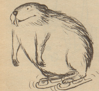
Illustrationsprobe aus «Aus meiner Menagerie»

«Jeder kennt Giovannettis fröhliche Tierzeichnungen aus dem Nebelspalter. Es bietet aber die Sammlung seiner poesievollen Einfälle in einem eigenen Bilderbuch «Aus meiner Menagerie», das im Nebelspalter-Verlag Rorschach in sorgfältigster Ausführung herausgegeben wurde, eine freudige Ueberraschung. Man blättert vergnügt und verweilt sich versonnen bei seinen Murretieren, Igel und Vögeln, die so viel Menschliches haben, daß wir uns in ihnen wiedererkennen.» Neues Winterthurer Tagblatt