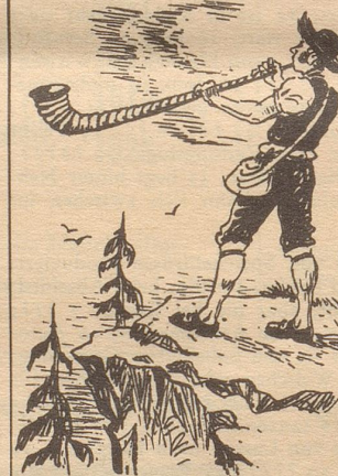
Das Alphorn und die «Horn am Munde».

Das Alphorn ist ein Instrument, das man nur in den Alpen kennt. Und wer's bedient, braucht notgedrungen viel Atem als auch große Lungen und ferner Trachtenmädchen. Die, die sammeln Geld und Sympathie!