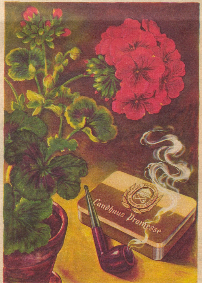
Ein Pfeifentabak mit natürlichem blumigem Aroma und auffallender Milde. Import-Klasse