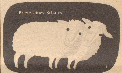
Briefe eines Schafes