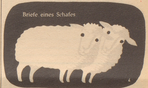
Briefe eines Schafes