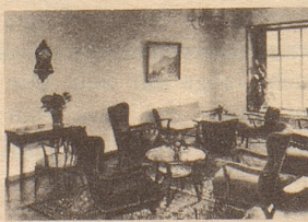
HOTEL ROYAL BASEL beim Badischen Bahnhof Direkt-Verbindung mit Tram Nr. 2 1953 vollständig umge- baut. - Royal-Stube mit Klimaanlage. - Ausge- wählte Spezialitäten. Größter Parkplatz Basels G. SCHLUCHTER

Der amerikanische General Foss setzte sich warm für die Emanzipation der Neger ein. Seine Schützlinge veranstalteten einmal ein großes Bankett zu seinen Ehren, und ein Neger schloß seinen Trinkspruch mit den Worten: «Es lebe der General Foss! Er hat zwar eine weiße Haut, aber ein schwarzes Herz.»