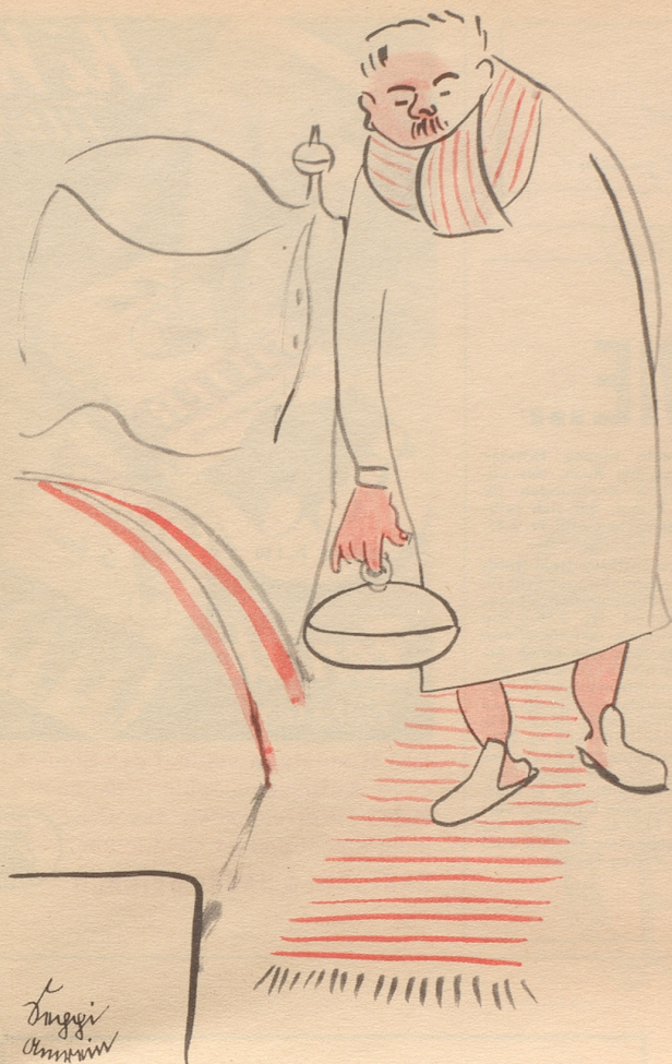
Curling auch im Sommer 1954