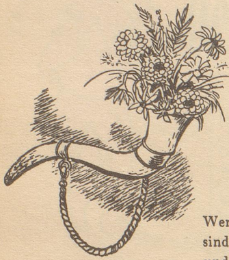
Das Turnerhorn und die «Horn am Munde».

Wenn Turner sich zum Kampf vereinen, sind ganze Dörfer auf den Beinen, und keiner ist dann stolzer als der mit dem Horn um seinen Hals, denn zarte Hände füllten's an mit Immergrün und Löwenzahn.