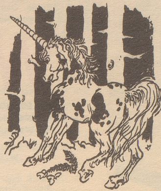
Das Einhorn und die «Horn am Munde».

Das Einhorn gab es leider nie im großen Reich der Zoologie. Es ist ein Pferd, ein Fabeltier und lebt drum nur auf dem Papier. In seinem Horn sah man vor Zeiten geheimnisvolle Fähigkeiten.