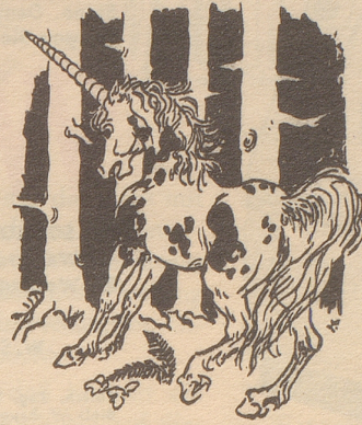
Das Einhorn und die «Horn am Munde».

Das Einhorn gab es leider nie im großen Reich der Zoologie. Es ist ein Pferd, ein Fabeltier und lebt drum nur auf dem Papier. In seinem Horn sah man vor Zeiten geheimnisvolle Fähigkeiten.