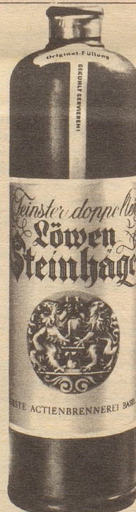
Erste Aktienbrennerei Basel