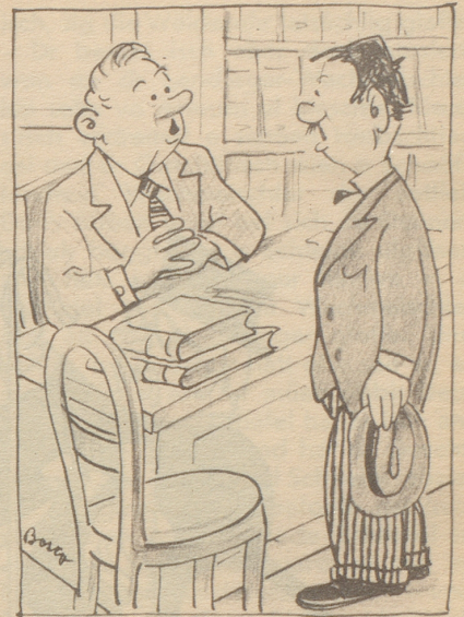
Auf dem Steueramt