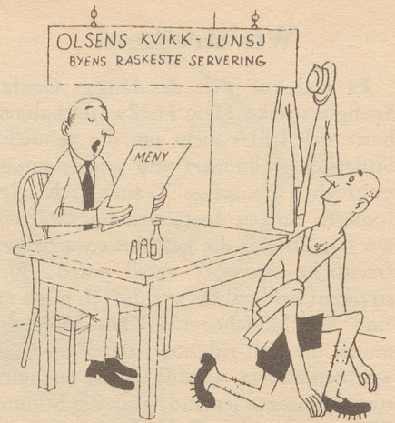
Das Restaurant mit der schnellsten Bedienung Tyrihans

Viele der verschiedenen Vehikel mit Aufschrift «Sonderfahrt» sehen manchmal schon eher nach einer sonderbaren Fahrt aus. bi