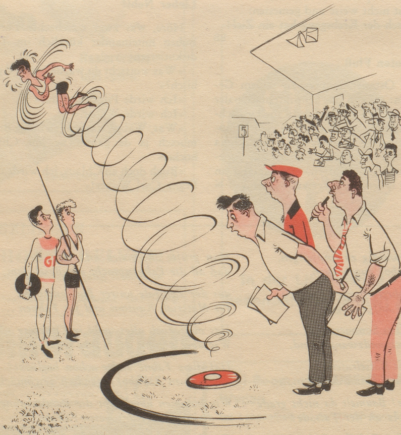
Fehlstart des Diskuswerfers!

Der Diskus gehört in die Gattung der Küsse. Es gibt verschiedene andere Kußarten: den Meniskus, den Krokus, den Zirkus, den Lokus und den Fiskus. Während man den Fiskus am liebsten durch die Oeffnung des Lokus' in die ewige Versenkung spülen möchte, ist der Zirkus spannend, der Krokus niedlich, der Meniskus schmerzhaft und der Diskus rund. Obwohl sich der Diskus nur in einem einzigen Buchstaben vom Fiskus differenziert, kann man nicht beide wegwerfen. Der Fiskus klebt beharrlich, der Diskus dagegen fliegt – je nach Gewandtheit des Athleten – bis zum Weltrekord-Resultat von 59,28 m, woran weder Luxus- noch Umsatzsteuer abgezogen werden. Das ist ein Trost: die sportlichen Ergebnisse bleiben immer brutto.