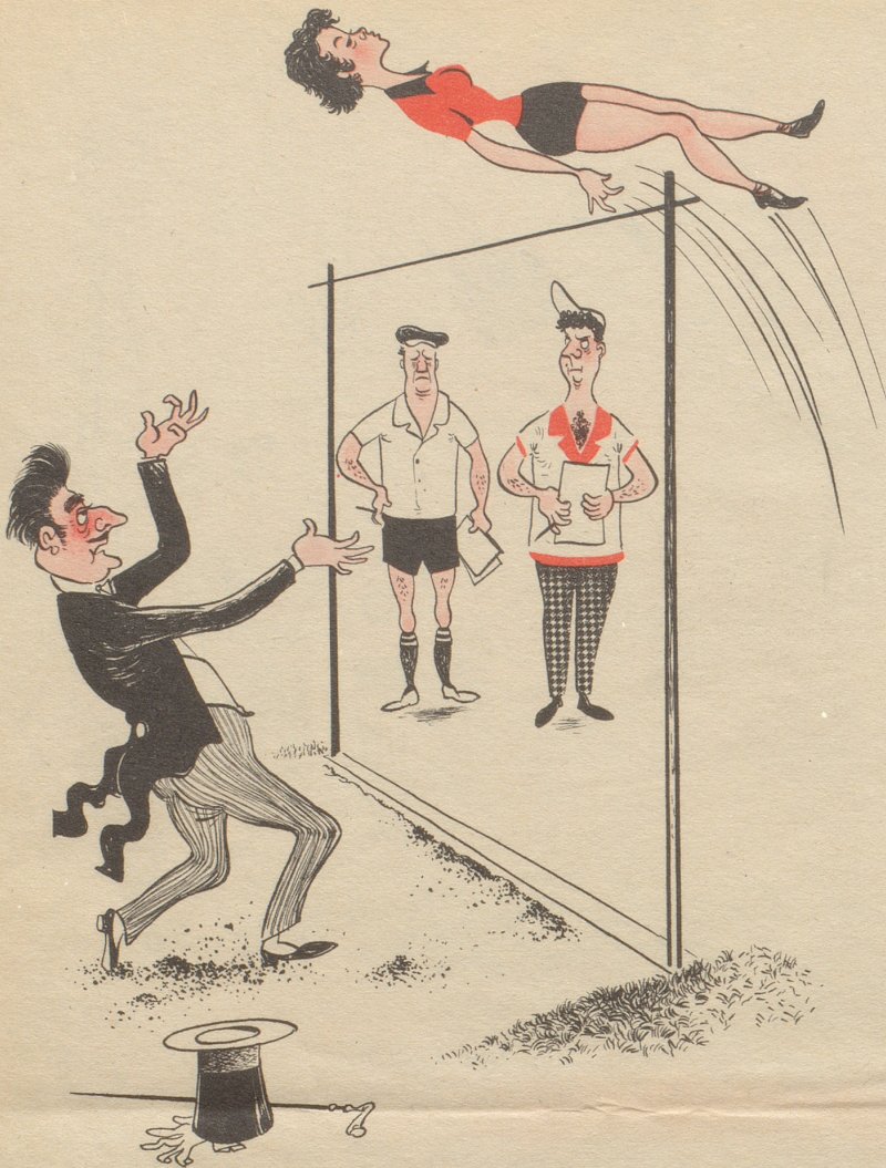
Eine Wettkämpferin hat Professor Miracolo als Trainer und Betreuer engagiert.

An einem Wiener Stammtisch gab ein Regierungsrat folgende Scherzfrage auf: «Ein Esel und eine Schnecke vereinbarten, einen Vierhundertmeterlauf auszugetragen. Wer kam wohl als erster ans Ziel?» Alles riet natürlich auf den Esel. «Nein, meine Herren, die Schnecke gewann den Preis, denn der Esel ging, wie alle Esel, den Dienstweg.» TR