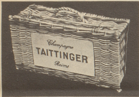
Generalagentur: Erste Actienbrennerei, BASEL Telephon (061) 34 30 43