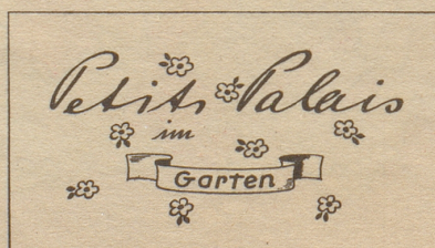
HOTEL BAUR AU LAC ZÜRICH