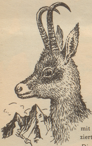
Das Gemshorn und die «Horn am Munde».

Die Originale der im Nebelspalter erschienenen Illustrationen sind käuflich Schreiben Sie an den Nebelspalter-Verlag Rorschach