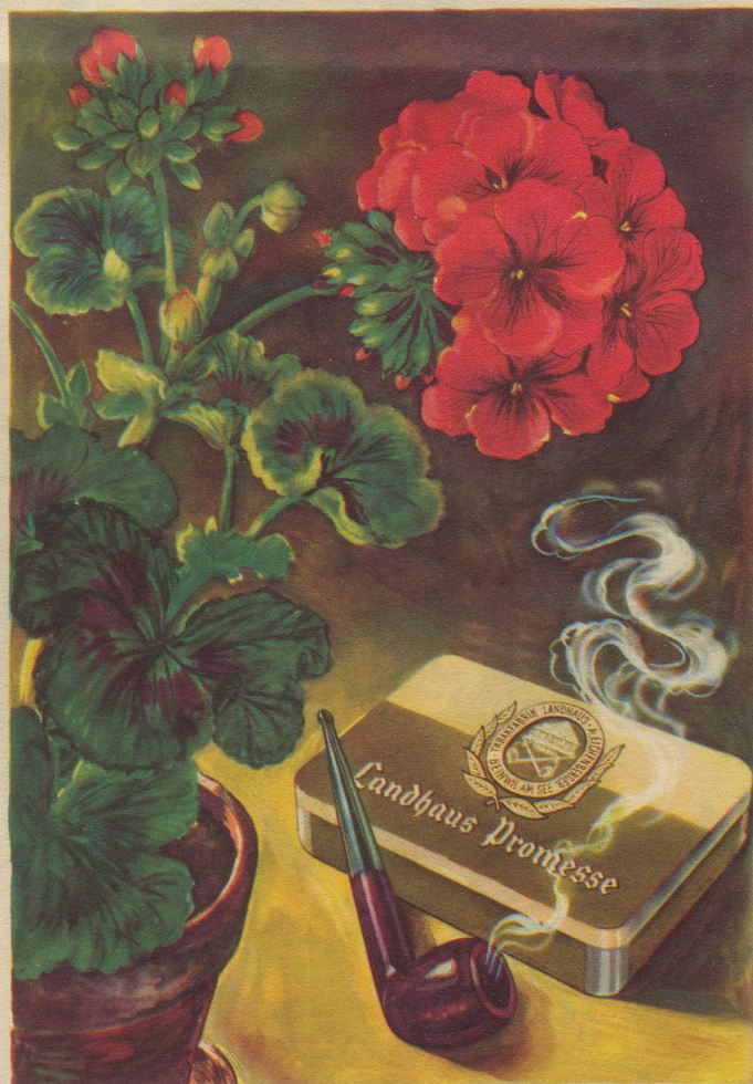
Ein Pfeifentabak mit natürlichem blumigem Aroma und auffallender Milde. Import-Klasse