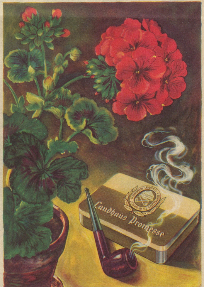
Ein Pfeifentabak mit natürlichem blumigem Aroma und auffallender Milde. Import-Klasse