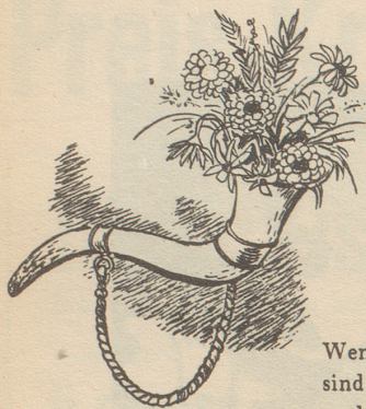
Das Turnerhorn und die «Horn am Munde».

Wenn Turner sich zum Kampf vereinen, sind ganze Dörfer auf den Beinen, und keiner ist dann stolzer als der mit dem Horn um seinen Hals, denn zarte Hände füllten's an mit Immergrün und Löwenzahn. Und folgt die «Horn» dem Siegerkranz so ist des Turners Freude ganz.