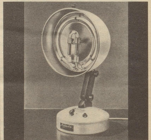
(Solaris, Quarzlampe mit Infrarot komb.)

Wenden Sie sich vertrauensvoll an uns. Als großes Zürcher Spezialgeschäft für Quarzlampen, haben wir eine enorme Auswahl an verschiedenen Marken-Lampen in allen Preislagen und bieten zudem beste Gewähr für eine fachmännische, neutrale Beratung.