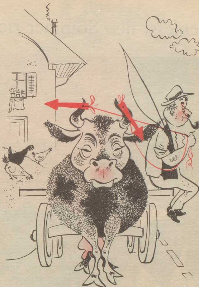
Auch landwirtschaftliche Fahrzeuge müssen Zeichen geben!