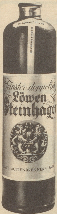
Erste Aktienbrennerei Basel