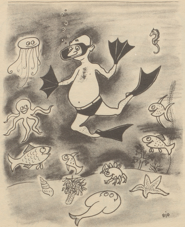
Der moderne Tauchsportler

Die Tiere: „Do chunnt wieder sonen abverheite Fisch!“