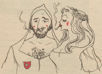
William Tell (Errol Flynn) und Hedy Tell (Gina Lollobrigida) in einer Drehpause

So etwa. Zwei Minuten nach dem Felsblock können die heroischen Geigen einsetzen, damit der Zuschauer merkt, daß alles o.k. ist. Und vergessen Sie nicht, die Freiheitsstatue in die Höhenfeuer zu überblenden, denn sonst könnte einer die Herkunft des größten Filmkunstwerks aller Zeiten übersehen. Und Peinlicheres könnte uns nicht widerfahren!