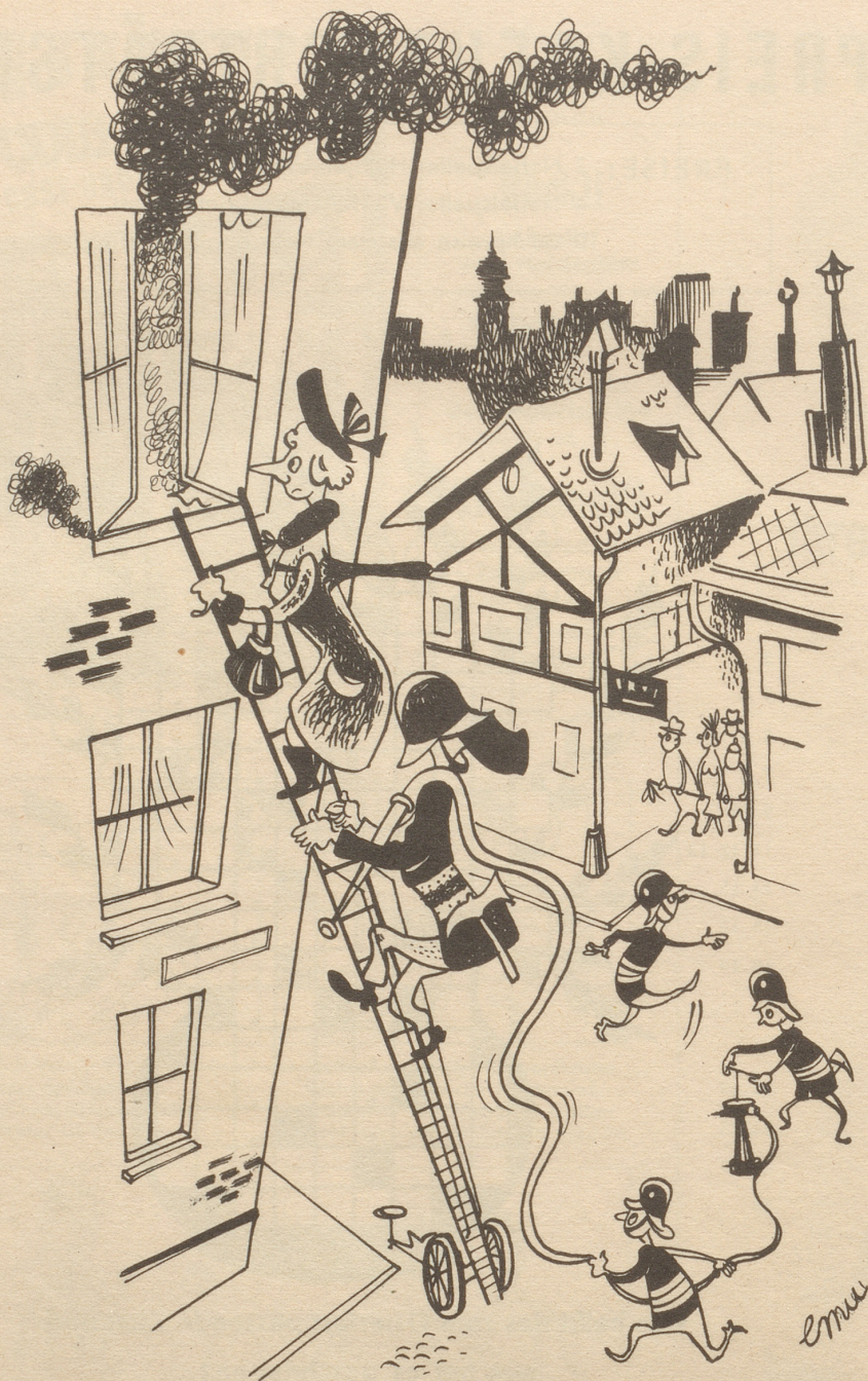
Die besorgte Feuerwehrmannsfrau