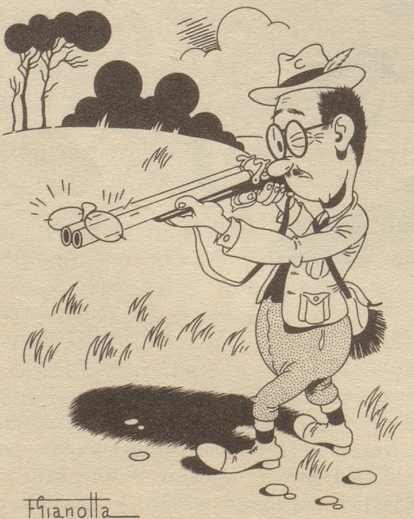
Der kurzsichtige Jäger