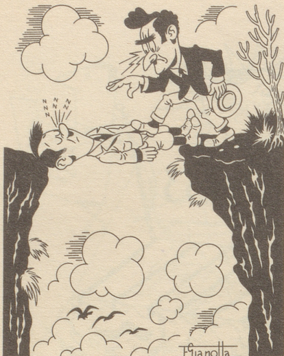
Der Hypnotiseur passiert einen Abgrund