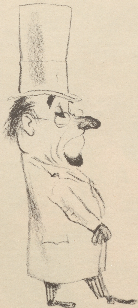
aber wemme gnau überleit, chann ich mir ...