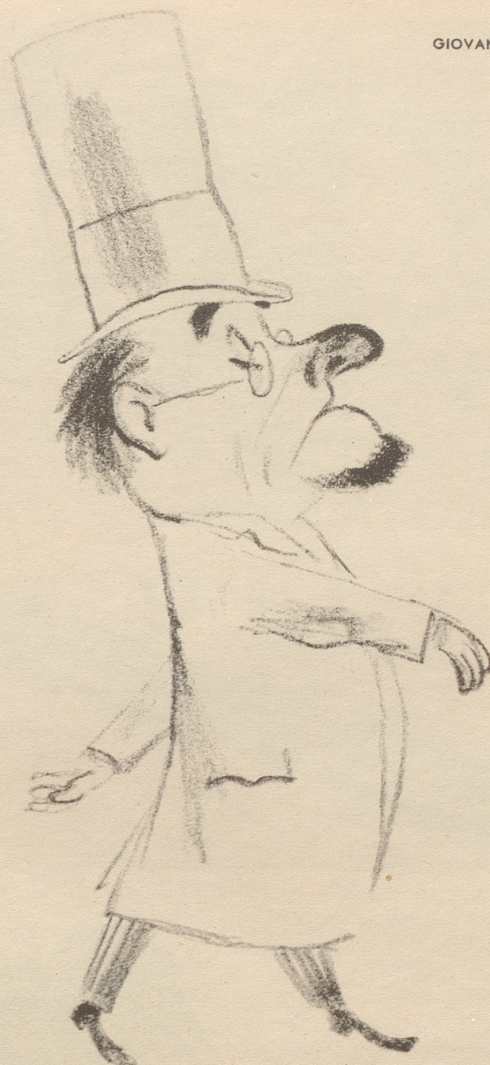
... sovill Begelschterig in mim Schtand nüd leischte.

und dem unbegrenzten Spielraum der Gefühle! Wir nähern uns mit Riesenschritten der Abdankung des Individuums und der endgültigen (?) Einordnung in eine höhere Ordnung, in das Nummern-Dorado. Herrliche Zeiten! Es wird dann buchstäblich alles fein säuberlich in Kategorien eingeteilt und numeriert sein, wobei die Summe aller uns von der hohen Test-Kommission für unsere körperlichen, geistigen und seelischen Eigenschaften zugeteilten und unanfechtbaren Nummern wiederum jene magische Zahl ergibt, die als Unterscheidungsmerkmal von den übrigen Totalen unserer lieben Mitmenschen dient. Eine düstere Prognose! Man wird auch nicht mehr lästige und völlig überflüssig gewordene Namen, sondern einfach Nummern tragen, womit die Degradierung zur Nummer auch amtlich bestätigt und besiegelt ist. Da aber desensungeachtet besagte menschliche Eigenschaften infolge der unbelehrbaren