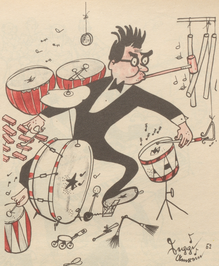
Der Mann, der sich buchstäblich durchs Leben schlägt