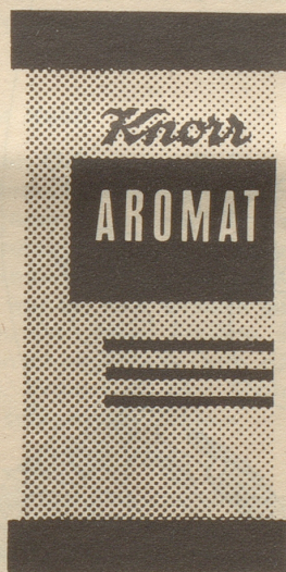
Aus Hefe-Extrakt, Glutaminat, Pflanzenfett, Gemüse, Kochsalz und Gewürze.