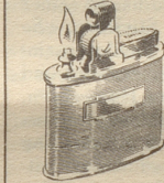
Ronson Standard in Chromglatt, guillochiert oder mit Eidechsenleder überzogen.

prächtig gearbeitet – Ein Geschenk von bleibendem Wert und zeitloser Eleganz.