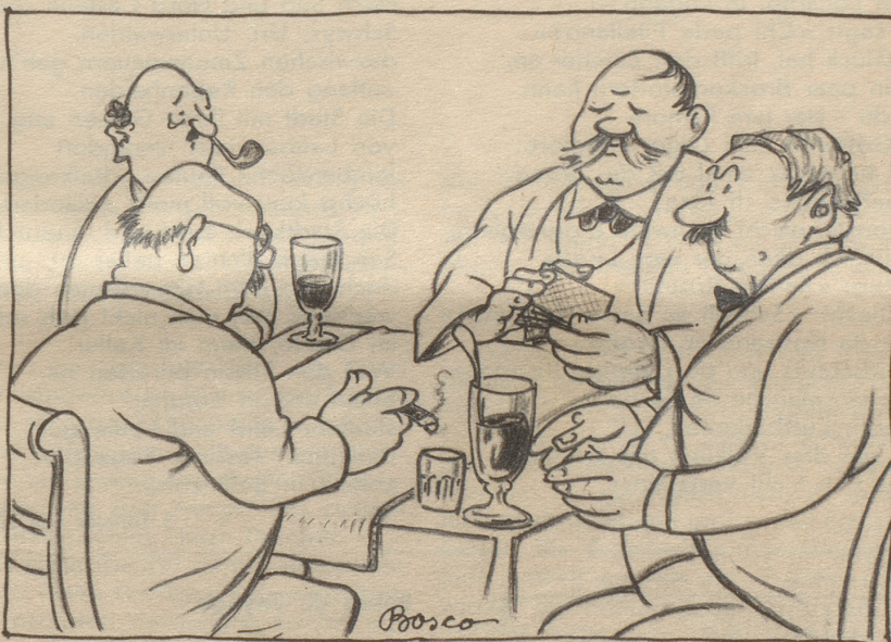
2. und sonigi wo „Stöck, Wis, Stich“ gilt.