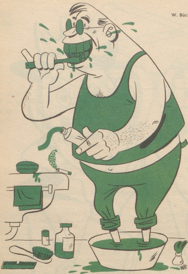
Es gibt bald keinen der Hygiene dienenden Artikel mehr, der nicht als chlorophyllhaltig angepriesen wird.

De Mäntsch vo hüt macht sichs in Sache Toalette liecht, Er chlorophyllisiert sich eifach bis er nüme riecht.